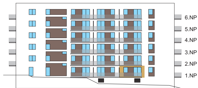
Východní pohled na dům/ Building View - East side